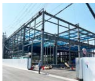
実験研究の試験体鉄骨